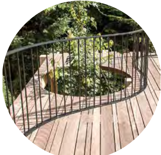
belvédère sur le parc