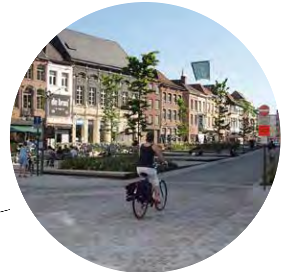
zone de rencontre / plateau partagé