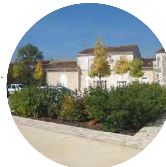
abords des maisons apaisés et végétalisés