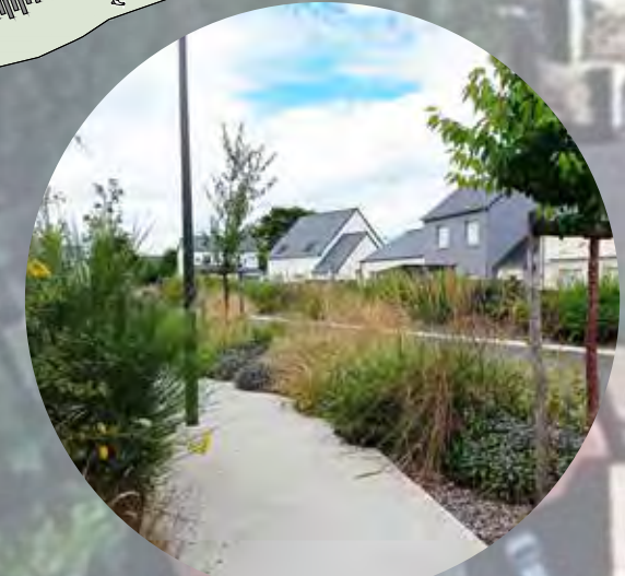
voie verte de 2.5m et bande plantée