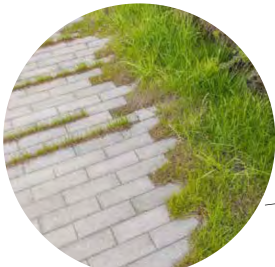
stationnement unilatéral végétalisé