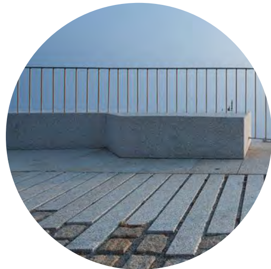
belvédère & mobilier urbain support de glisse

13 arbres plantés 39% de surfaces desimperméabilisées 10 m 2 de pavés réemployés