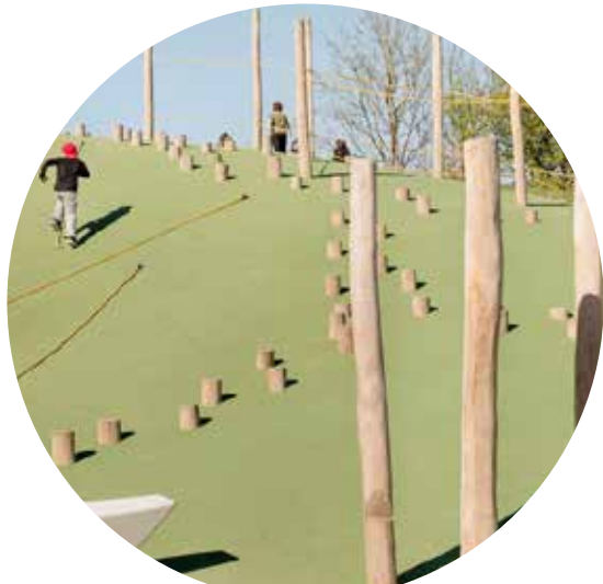
talus support d'aire de jeux