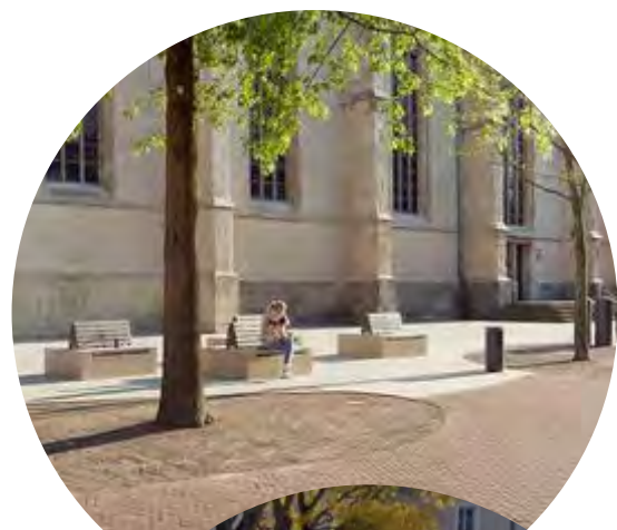
place stationnée végétalisée / pavés