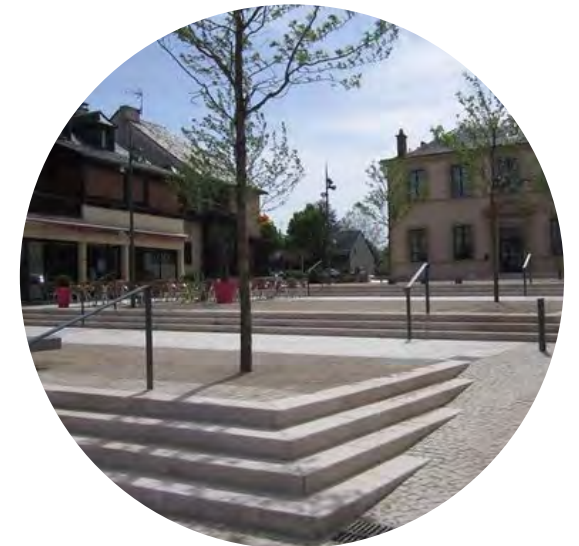
aménagement en terrasses