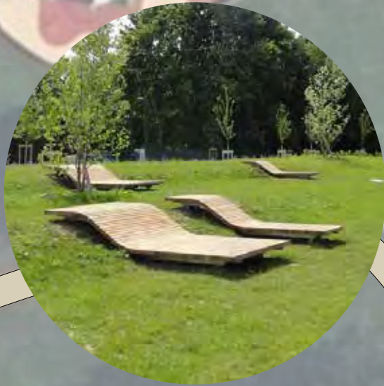
prolongement du parc dans le bourg dans un espace de 600m 2

14 arbres plantés 36% de surfaces desimpermeabilisées 130 m 2 de pavés réemployés