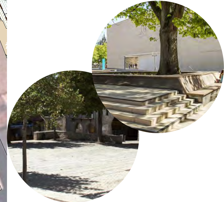
place animée : terrasse de café, marché, animations