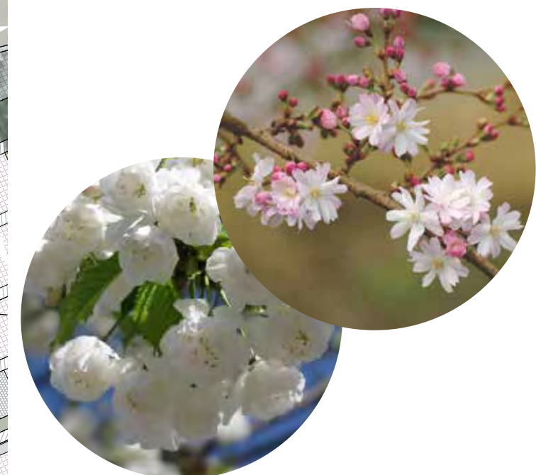
abords du bourg soignés